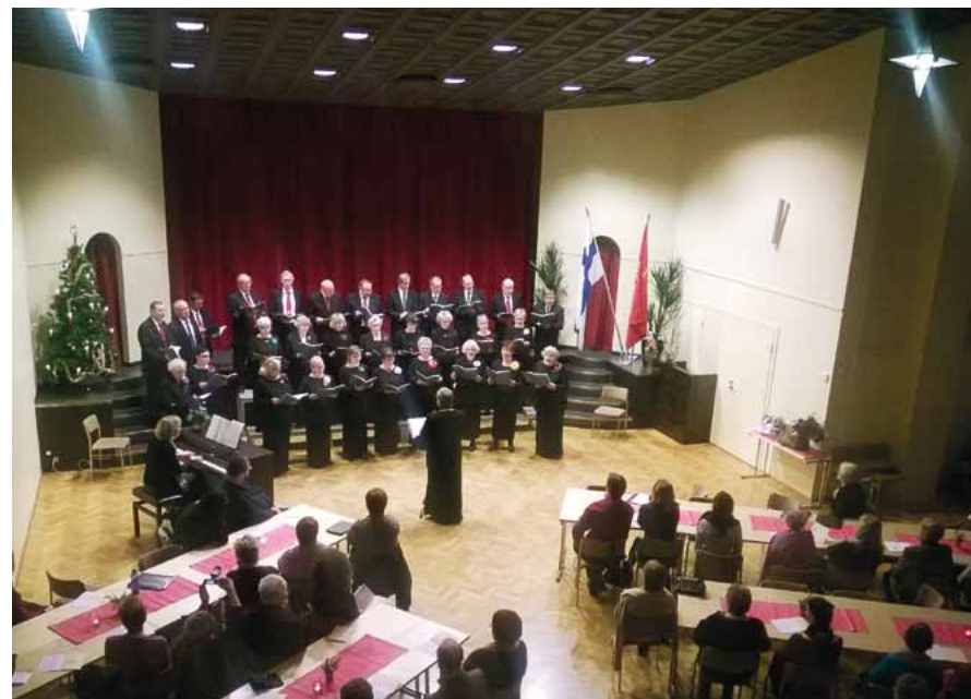
Aallon Laulajat 125-vuotisjuhlissaan.