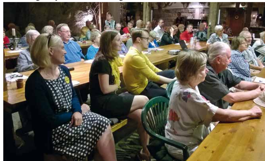
JTY:n jäsenet koolla yhdistyksen tulevaisuuden suuntaviivoja hahmottamassa

Toimintavuoden alkajaisiksi johtokunta aloitti Jyväskylän Työväenyhdistyksen strategian työstämisen. Strategian tekeminen kulki koko toimintavuoden