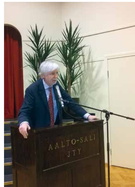
Ulkoministeri Erkki Tuomioja puhui paljon ja asiaa.

ma 8.12. Järjestettiin Aalto-salissa avoin keskustelutilaisuus. Ulkoministeri Erkki Tuomiojan alustusta ”Ukraina, Venäjä, Suomi. Ajankoh- taista ulkopoliitikasta” saapui kuule- maan 130 henkeä.