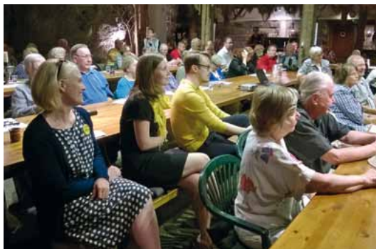
JTY:n jäsenet koolla yhdistyksen tulevaisuuden suuntaviivoja hahmottamassa.

pe 8.8. Saapui SDP:n tuore puheenjohtaja Antti Rinne Jyväskylään. Yhdessä SDP:n Keski-Suomen piirin kanssa järjestettiin tapahtuma Kävelykadulla sekä puheenjohtajan haastattelutunti Aalto-salissa. Kävelykadulla mukana oli myös peruspalveluministeri Susanna Huovinen. Kävelykadulla kahvista nautti n.200 henkeä ja Aalto-salin haastattelutuntia kuunteli 70 henkeä.