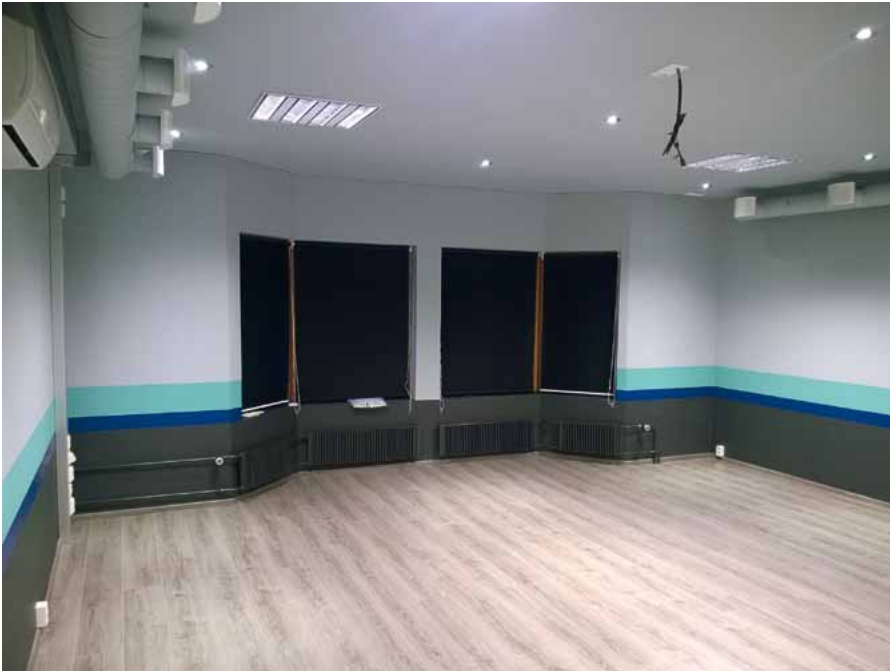
Kauppakatu 30:n neljännessä kerroksessa helmikuussa käyttöön otettu uusi spinnig-tila.

Yhdistyksen omistamissa kiinteistöissä (Kauppakatu 30 ja Aalto-sali) suoritettiin toimintavuoden aikana normaaleja kunnossapitotoimia ja ylläpito-korjauksia. Kauppakatu 30 neljännen kerroksen tiloissa remontoitiin kaksi toimistotilaa kuntosalikäyttöön tammi-helmikuussa.