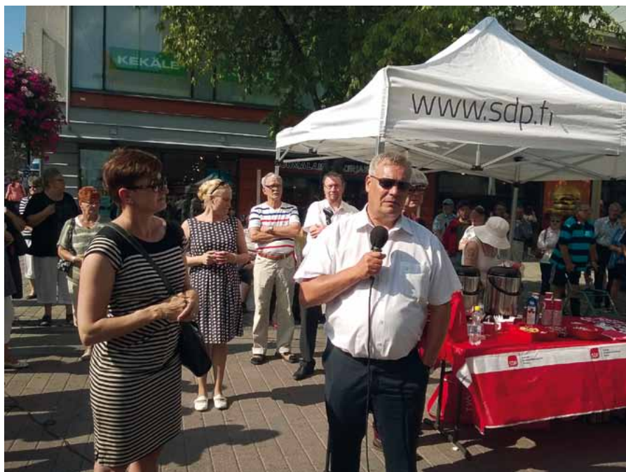
SDP:n toukokuussa valittu puheenjohtaja Antti Rinne kävelykadulla elokuussa, mukana myös peruspalveluministeri Susanna Huovinen.

Toukokuussa demariväki kokoontui Seinäjoelle SDP:n puoluekokoukseen. Antti Rinne haastoi puheenjohtajakamppailussa Jutta Urpilaisen ja ensi kertaa puolueen historiassa istuva puheenjohtava vaihtui äänestyksen jälkeen Rinteen viedessä voiton niukasti seitsemän äänen erolla. Samalla vaihtui myös hallituksen valtiovarainministeri Antti Rinteen ottaessa hoitaakseen vaativan tehtävän.